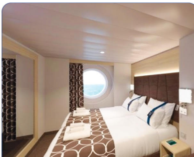
کابین OCEAN VIEW با پنجره ثابت