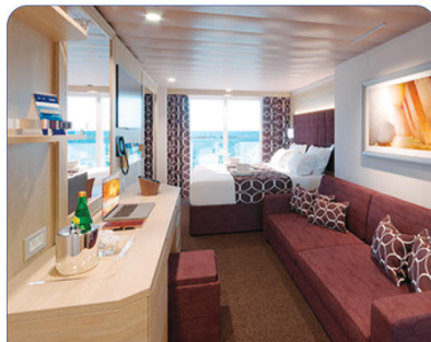
کابین BALCONY با یک تراس خصوصی